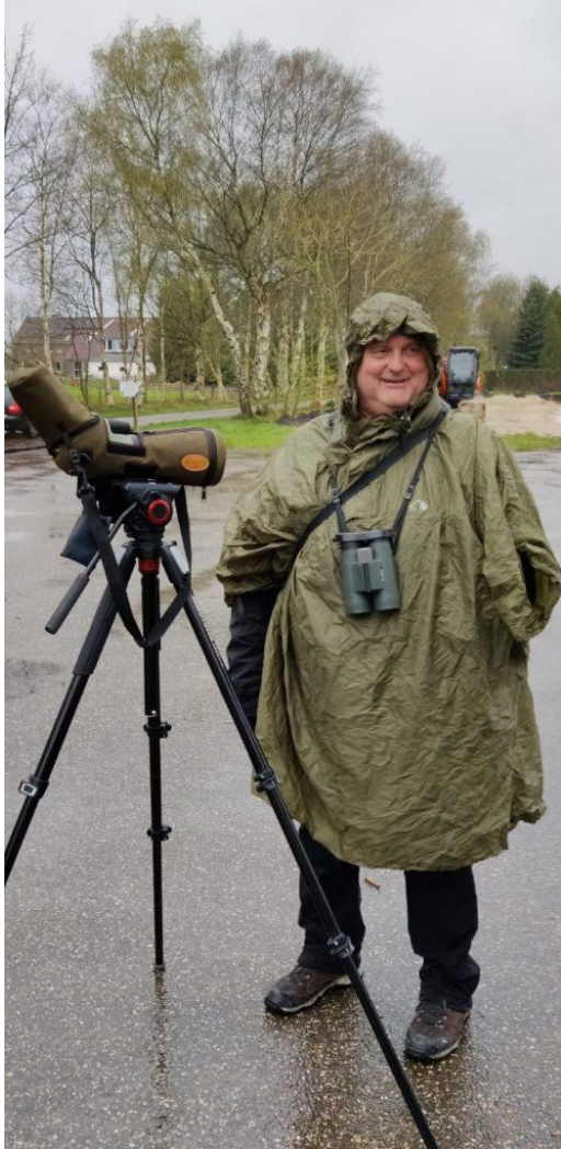
Manche können alles tragen!