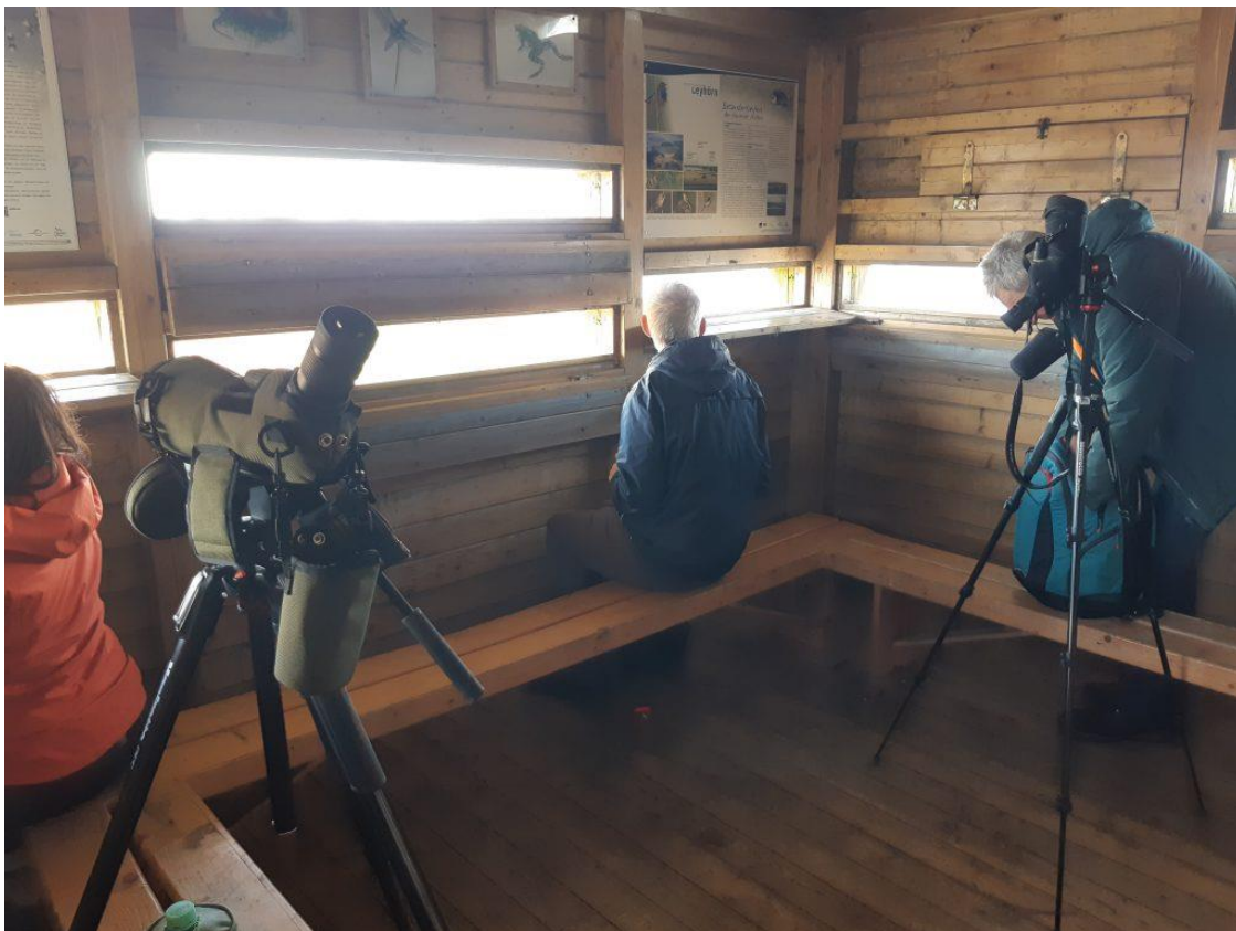
Zwei coole Beobachtungshütten