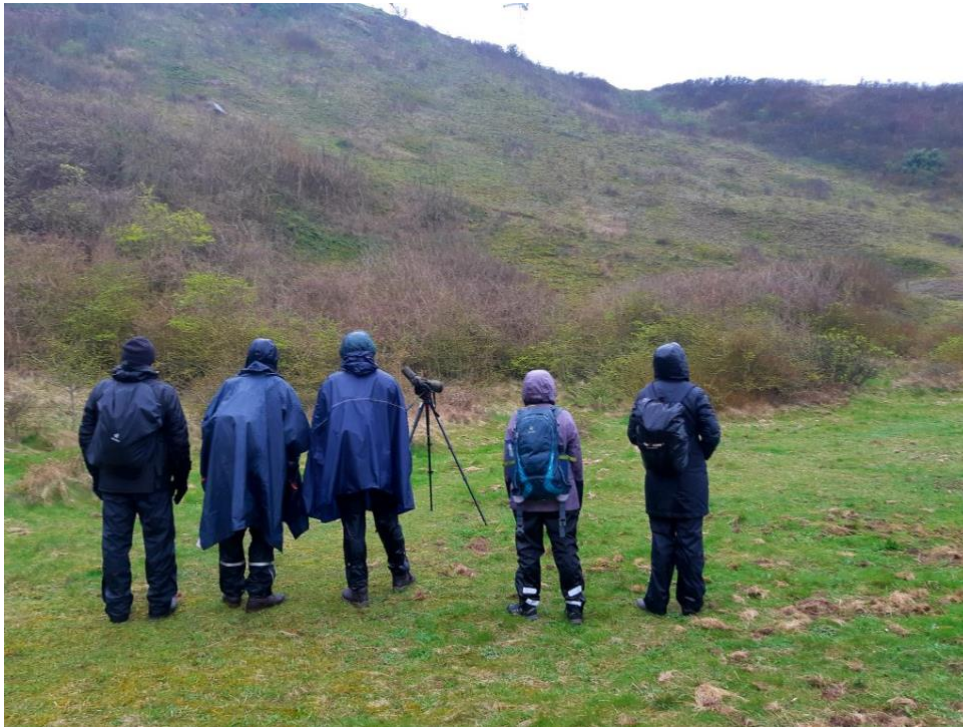
Windstill im Mittelland