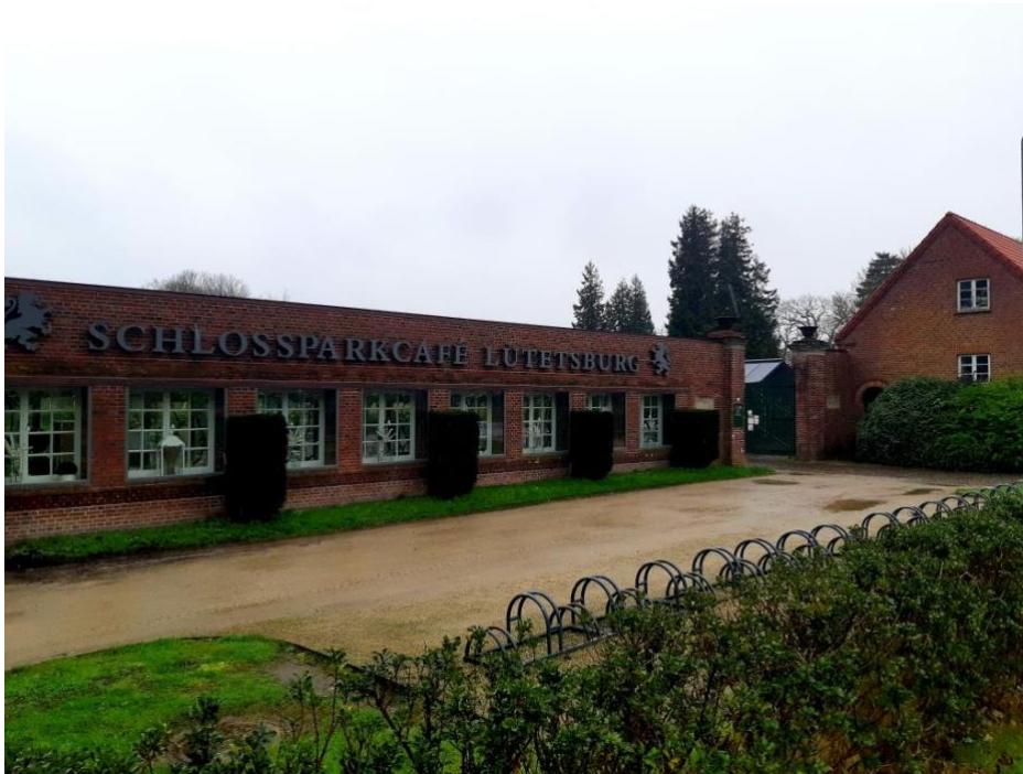
Zum Aufwärmen ins Cafe

Sommergoldhähnchen, Kleiber, Gartenbaumläufer, Kernbeißer und vier Spechtarten sind für Friesland im Regen sicher eine gute Ausbeute.