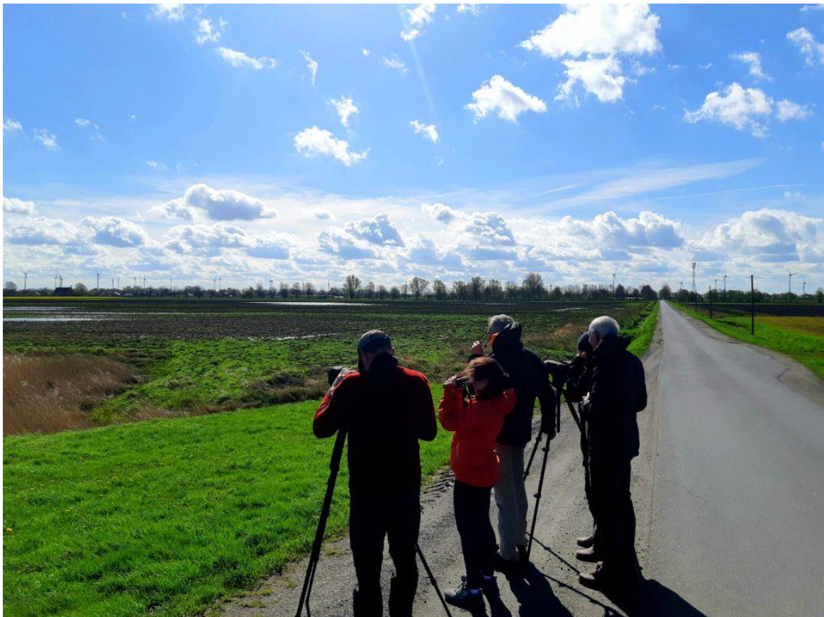
Uferschnepfen und Bekassinen