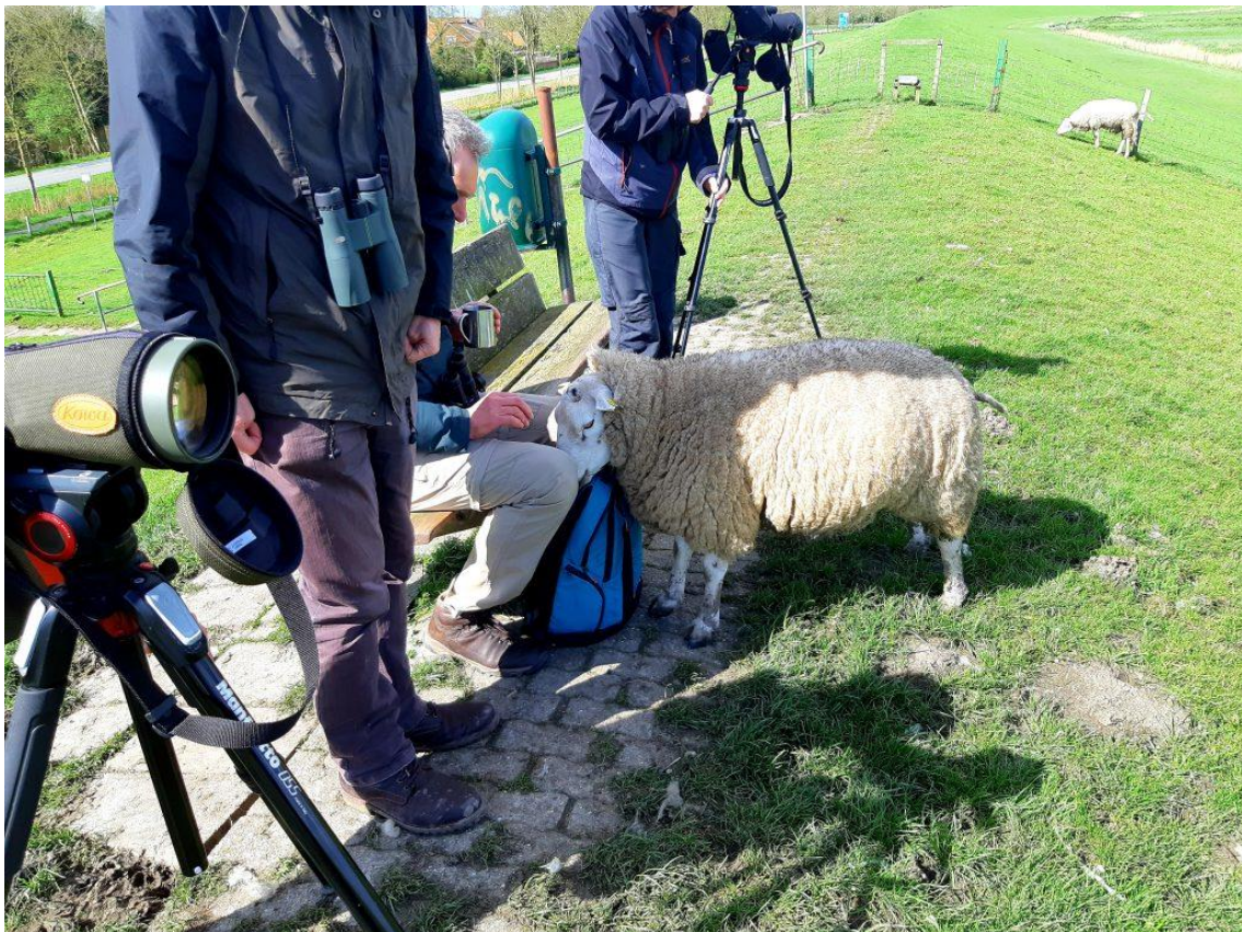
Der Hausherr sieht nach dem rechten