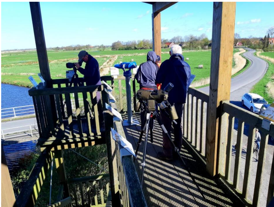
Am Großen Meer

Bei Sonnenschein und (wie immer) starkem Wind haben wir heute noch drei Beobachtungsstopps eingelegt. Dabei konnten wir erneut viele Vögel entdecken.