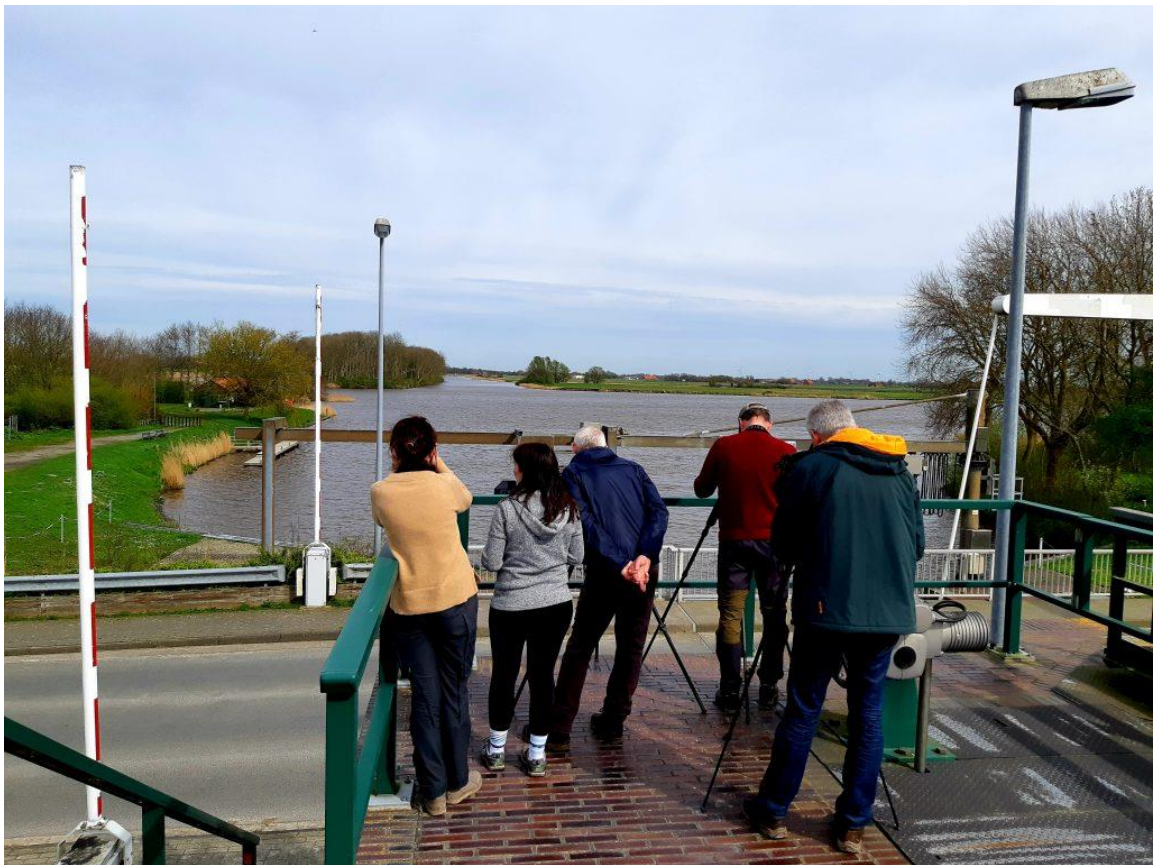
erste Uferschwalbe entdeckt