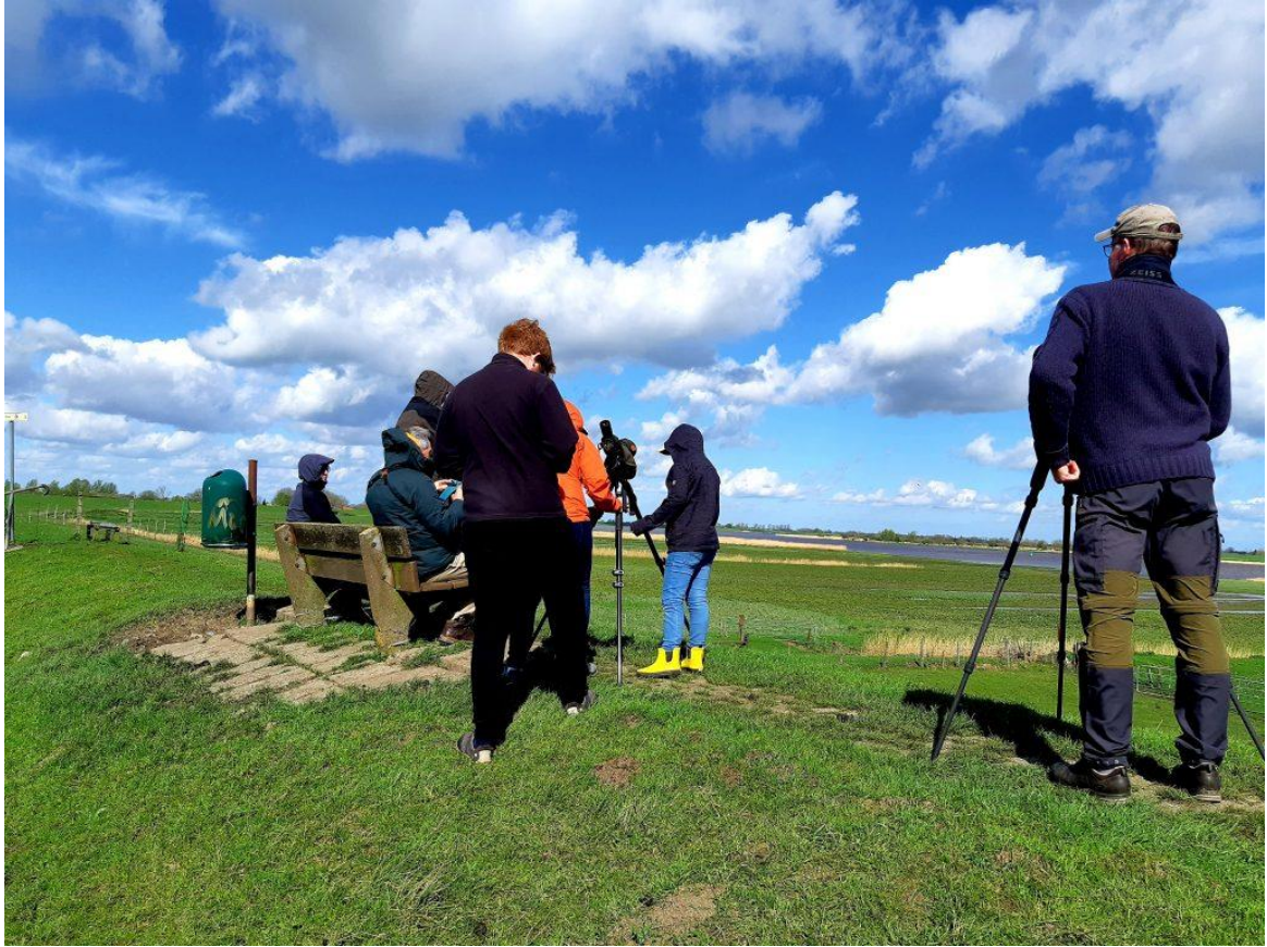
An der Ems