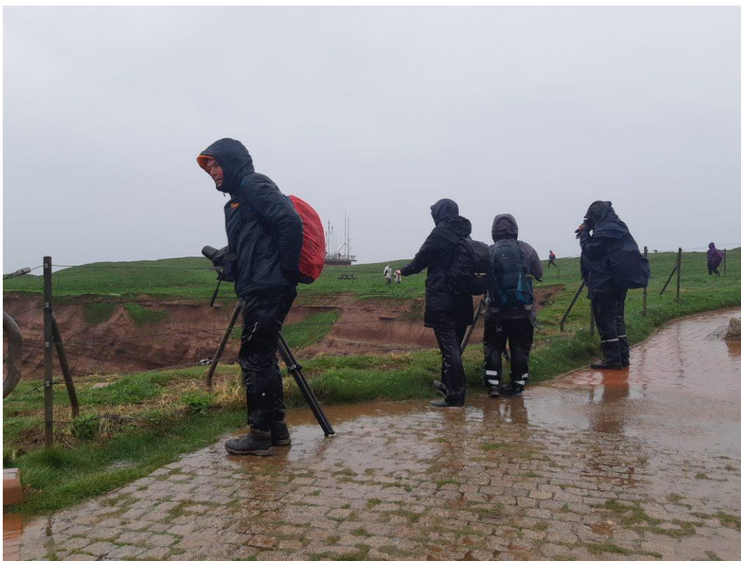
Sturm auf dem Oberland

Trotzdem konnten wir die fünf Hochseearten die auf Helgoland brüten alle sehen. Basstölpel, Trottellumme, 13möwe, Tordalk und Eissturmvogel. Total durchnässt gingen wir wieder aufs Schiff, aber Mission erfüllt.