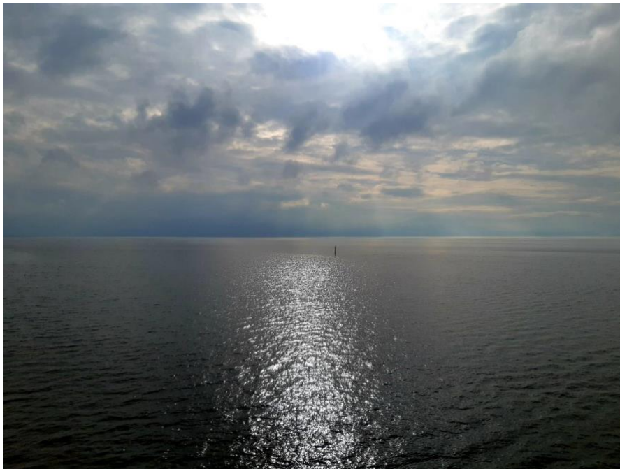
Morgen geht es weiter.