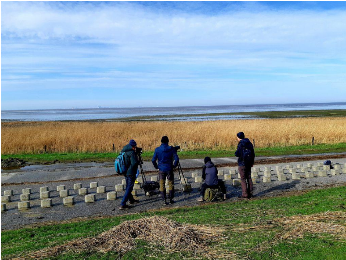
Nach der dreistündigen Dusche von gestern konnten wir heute Wärme und Sonne genießen, aber der Wind ist immer noch stark.