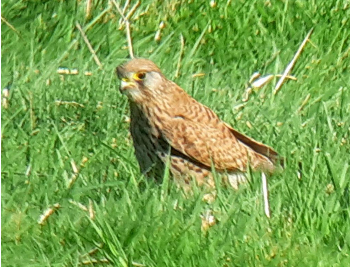
Frau Turmfalke hat gespeist