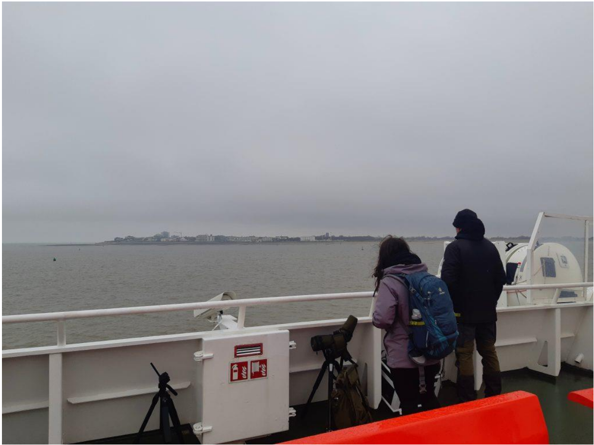
Norderney in Sicht

Die Tagestour nach Norderney ist immer gut, heute war sie klasse! Leichter Regen zu Beginn . Endlich mal wenig Wind! Am Nachmittag kam sogar die Sonne.