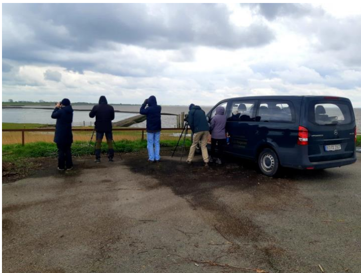
Auf der „Bohrinsel“

Auf unserem Weg nach Leezdorf machen wir immer am Dollart Station. Auch heute hat sich das wieder gelohnt. Enten, Limikolen, Rohr- und Kornweihe und singende Blaukehlchen. Möwenkunde gleich am ersten Tag.